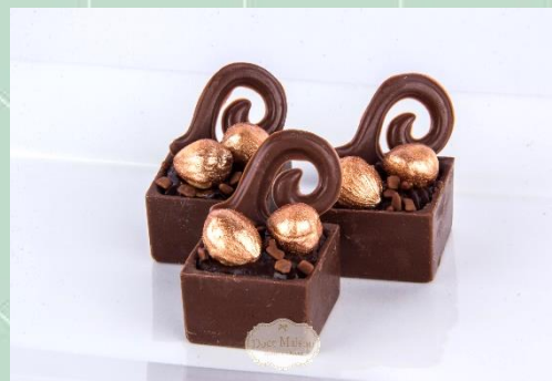
Caixinha de Avelãs