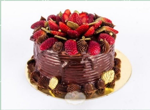
Torta de Morango com Sufclair