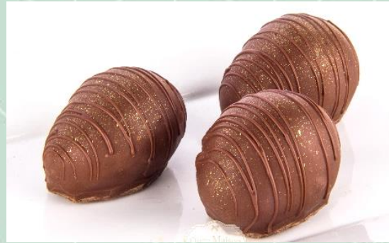
Bombom de Morango