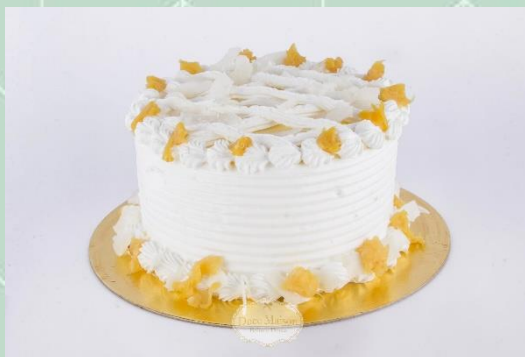
Torta de Abacaxi com Coco