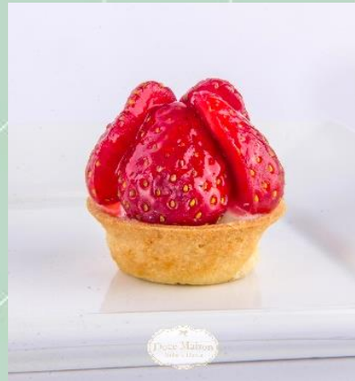
Tartelete de Morango