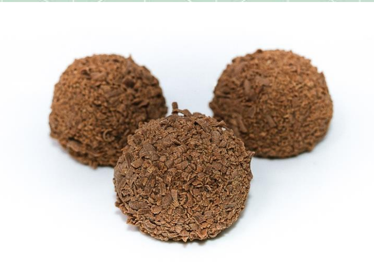
Brigadeiro Preto na Raspa de Chocolate ao Leite