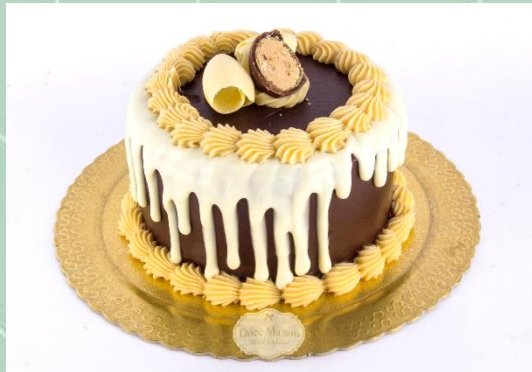
Torta de Sonho de Valsa