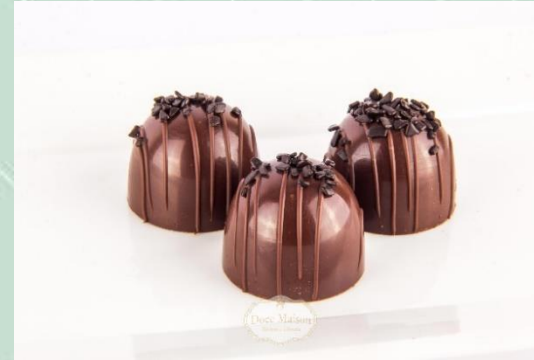
Trufa de Chocolate Meio Amargo