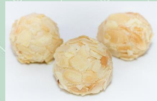
Brigadeiro de Amêndoas