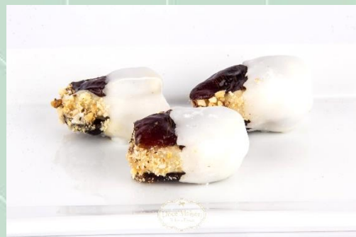
Tâmara Recheada com Creme de Castanha Fondado