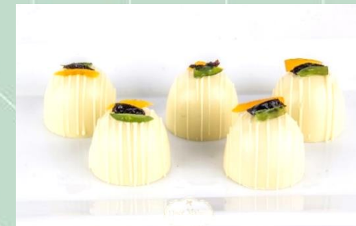
Trufa de Frutas Secas