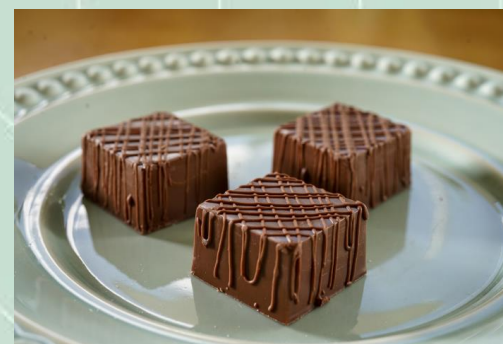
Fadinha de caramelo belga