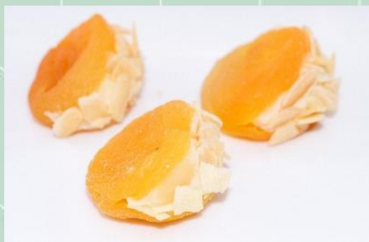
Damasco Recheado Passado na Amêndoas