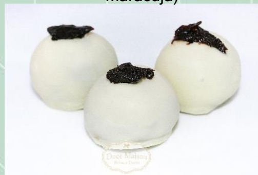
Bombom de Ameixa