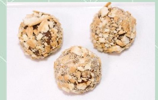
Brigadeiro de Palha Italiana