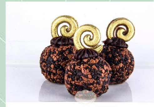
Brigadeiro Rei Recheado