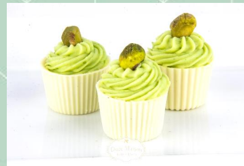
Docinho Mini Cupcake de Pistache