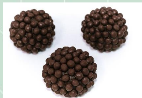
Brigadeiro Belga no Crispy Meio Amargo