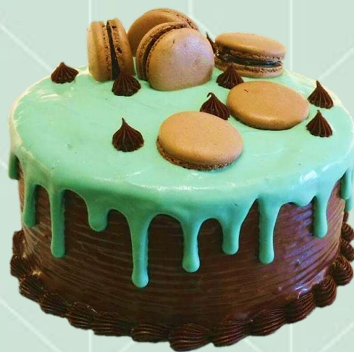
Bolo "Dreep Cake"