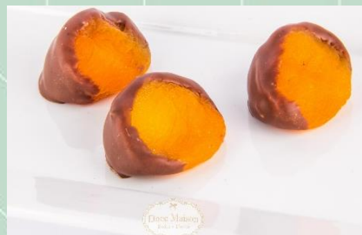
Damasco Recheado no Chocolate