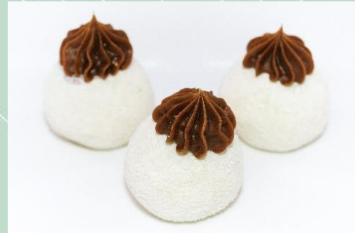
Brigadeiro de Leite Ninho com Nutela