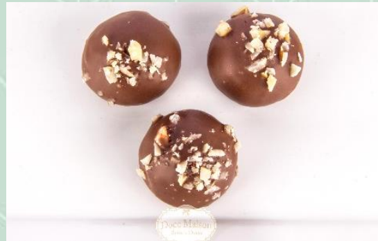
Bombom de Castanha do Pará