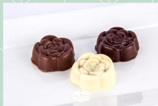
Rosas de Chocolate Recheadas