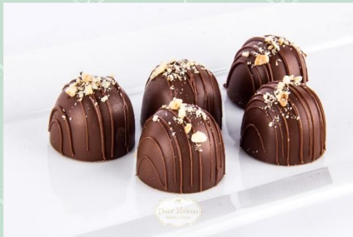
Trufa de Castanha do Pará