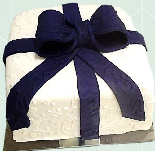
Bolo decorado com pasta americana clássico