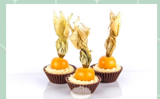
Tartelete de Physalis