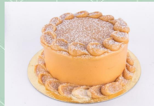
Torta Bem Casado