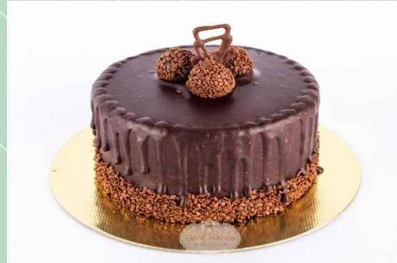
Torta de Brigadeiro