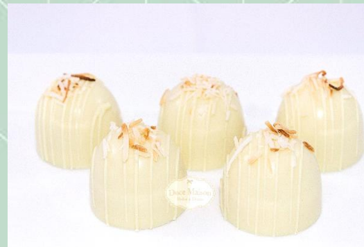
Trufa de Chocolate Branco com Coco Queimado