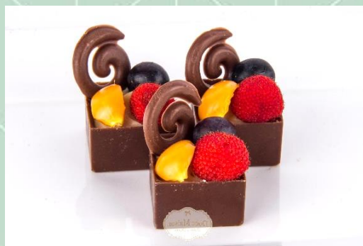
Caixinha Delicia Tropical