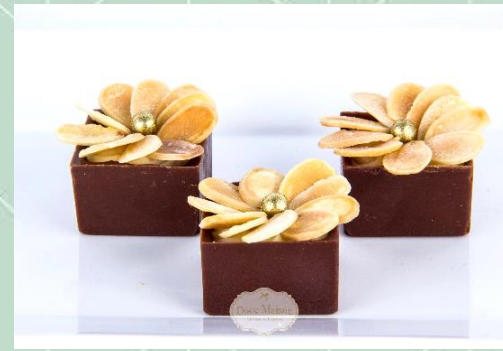
Flor de Amêndoas com Creme de Champagne