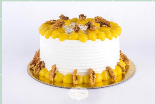
Torta de Nozes com Baba de Moça