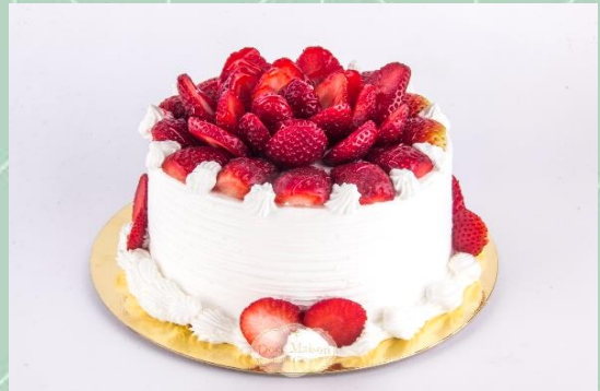
Torta de Morango