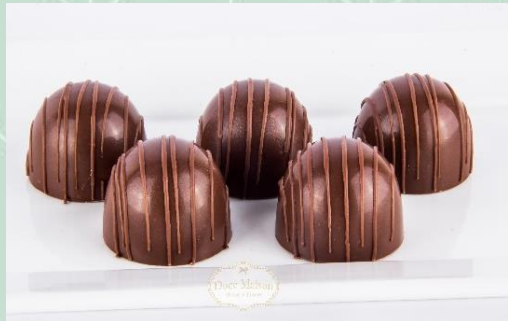
Bombom de Brigadeiro Preto