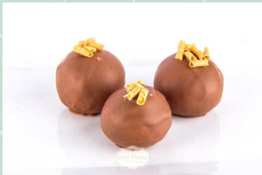
Trufa de Caramelo