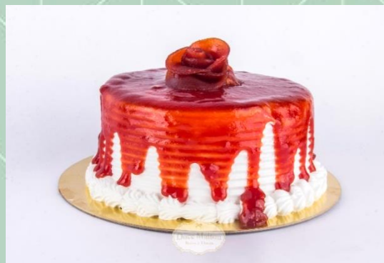
Torta Romeu e Julieta