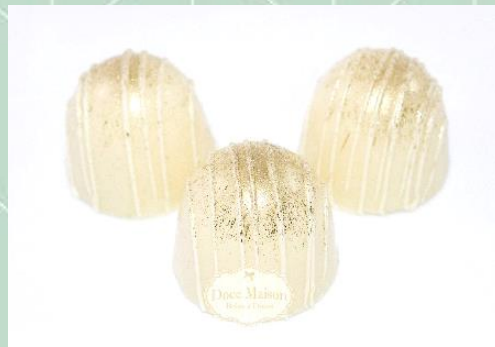
Trufa de Chocolate Branco (Disponível nos sabores limão e maracujá)