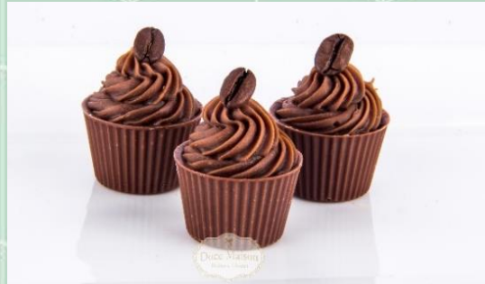
Docinho Mini Cupcake de Café