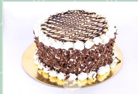
Torta Ariane (carro chefe)