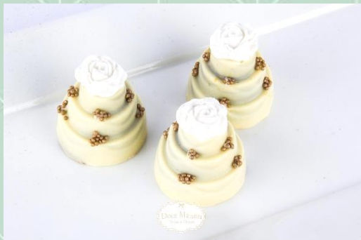
Mini Bolinho Recheado