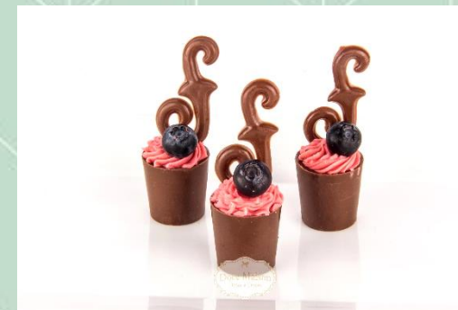
Copinho de Blueberry