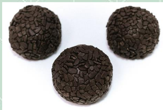
Brigadeiro 100% Belga Meio Amargo