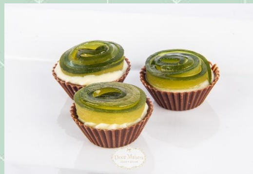
Tartelete de Mamão