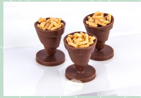
Tacinha de Caramelo