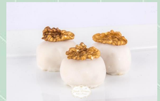
Camaféu de Nozes Fondado