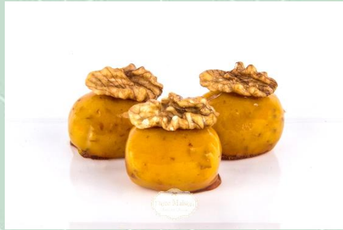
Caramelizado de Nozes