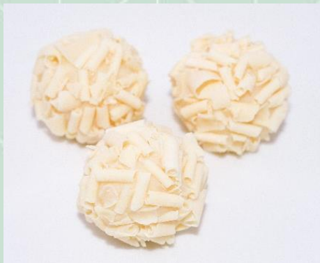
Brigadeiro Belga no Blosson Branco