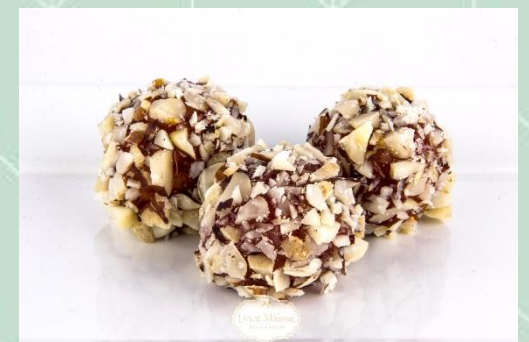
Castanha do Pará Caramelizado