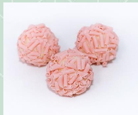
Brigadeiro Belga no Blosson de Morango