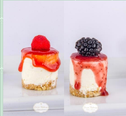
Mini Cheesecake de Frutas Vermelhas