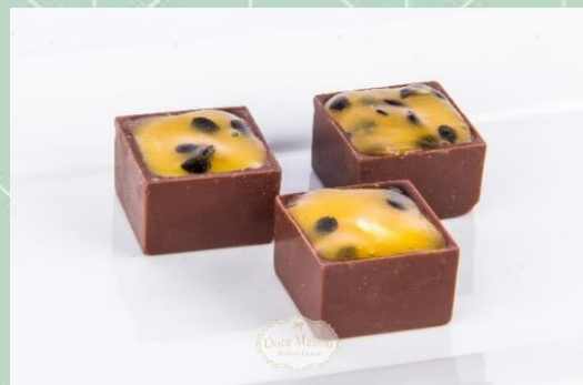
Caixinha de Maracujá