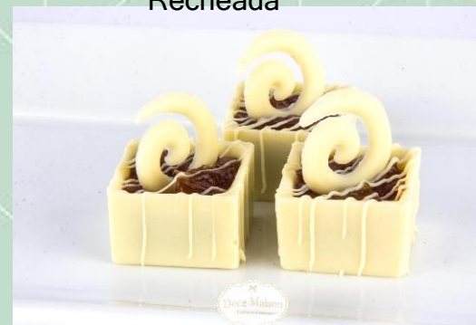
Caixinha de Banana