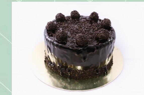
Torta de Chocolate Meio Amargo