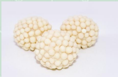
Brigadeiro Belga no Crispy Branco