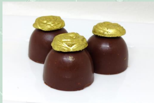
Bombom de Abacaxi com coco