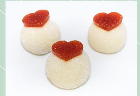
Brigadeiro de Romeu e Julieta