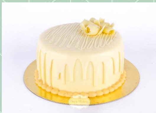
Torta de Chocolate Branco