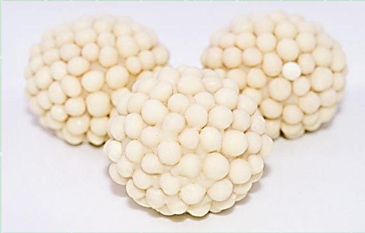
Brigadeiro Branco no Ball