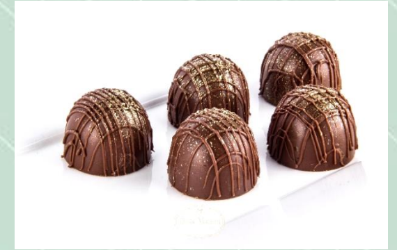
Trufa de Chocolate ao Leite