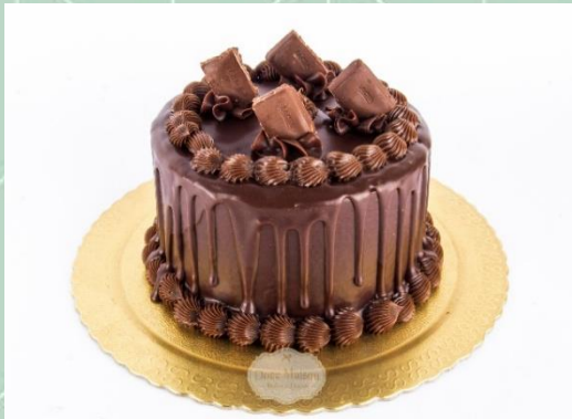
Torta Diamante Negro