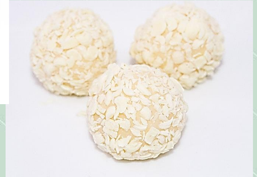
Brigadeiro Branco na Raspa de Chocolate Branco