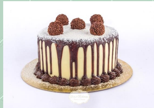
Torta de Leite Ninho com Brigadeiro