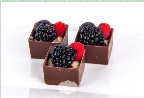
Caixinha de Frutas Vermelhas