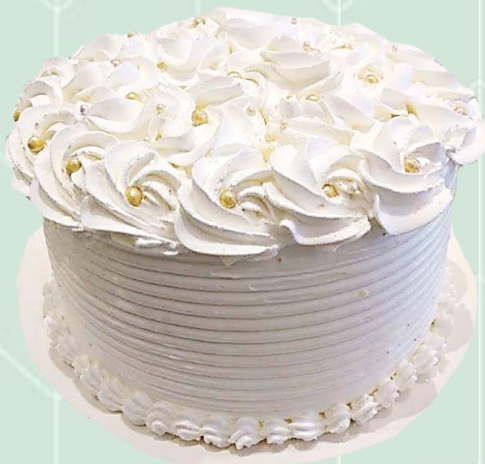
Bolo decorado com bico de rosa - 1 cor