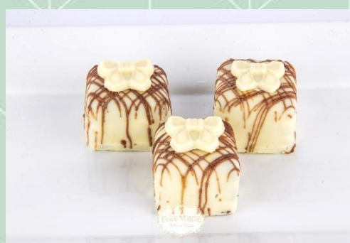
Presentinho de Palha Italiana