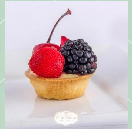
Tartelete de Frutas Vermelhas