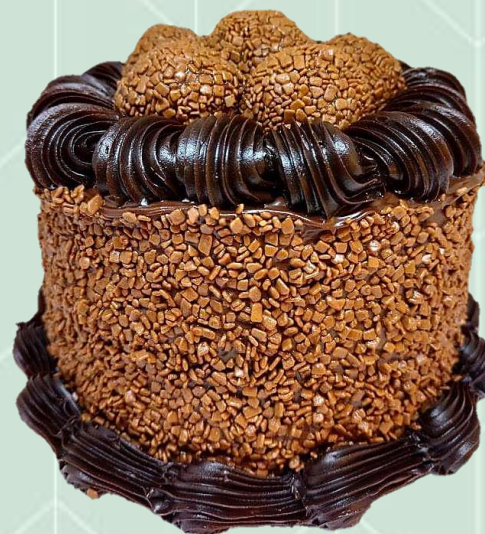
Bolo todo coberto com Split Belga