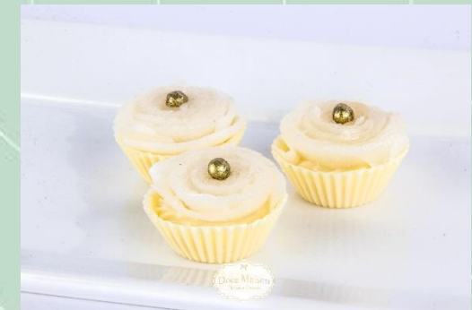
Flor de Coco