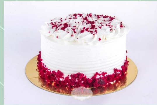
Torta de Red Velvet