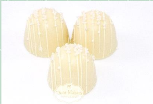
Trufa de Champagne