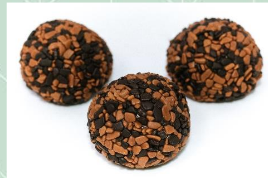
Brigadeiro 100% Belga de Café