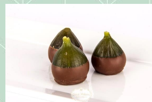
Figo Recheado com Creme de Champagne