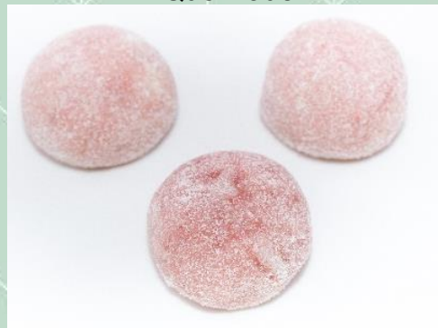
Brigadeiro de Frutas Vermelhas