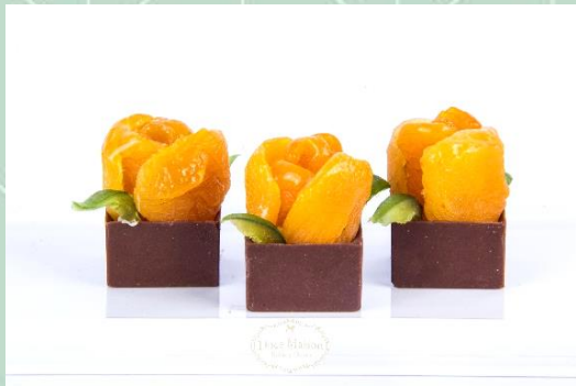
Flor de Damasco