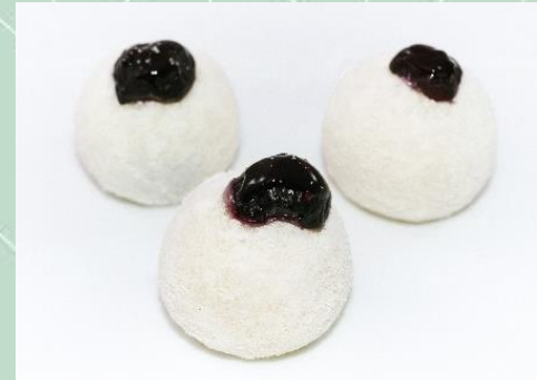
Brigadeiro de Leite Ninho com Blueberry