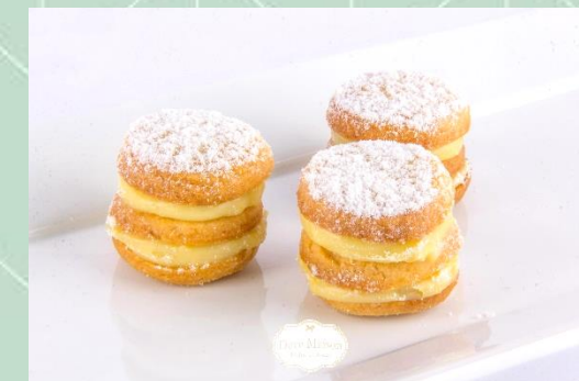
Biscoito Amanteigado de Leite Condensado