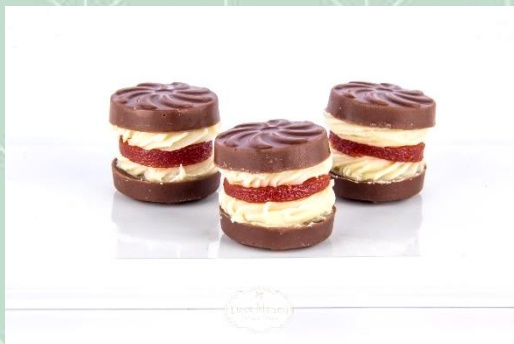
Sushi de Goiabada