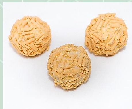
Brigadeiro Belga no Blosson de Caramelo