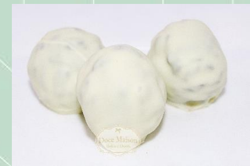
Bombom de Oreo