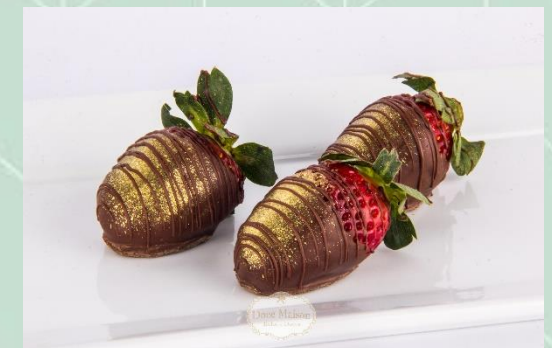
Morango Banhado no Chocolate