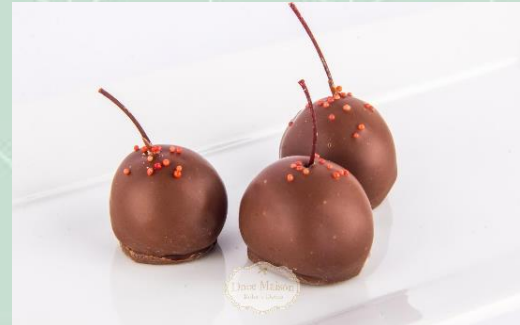
Bombom de Cereja ao Leite