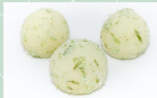
Brigadeiro de Caipirinha