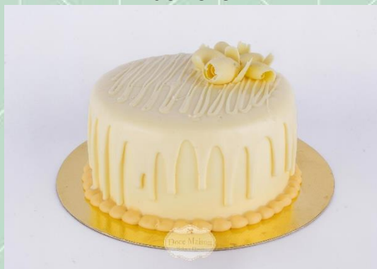
Torta de Leite Condensado