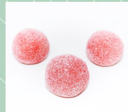
Bicho de Pé