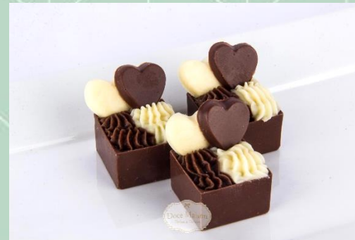
Caixinha Dois Amores