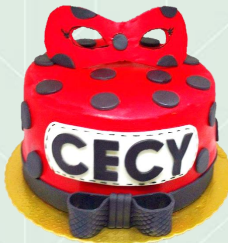
Bolo decorado com pasta americana - infantil