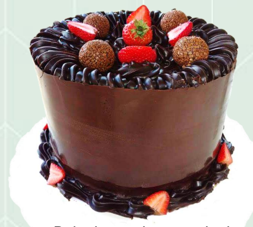
Bolo decorado com tala de chocolate