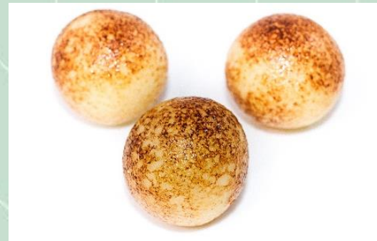
Brigadeiro de Creme Brulee