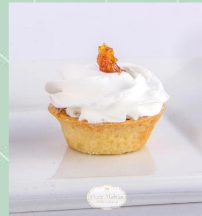
Tartelete de Banana