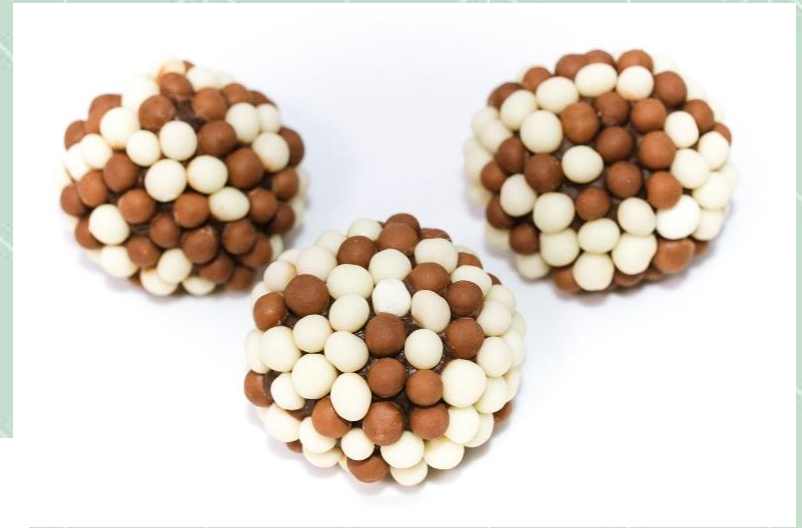
Brigadeiro Preto no Ball Misto