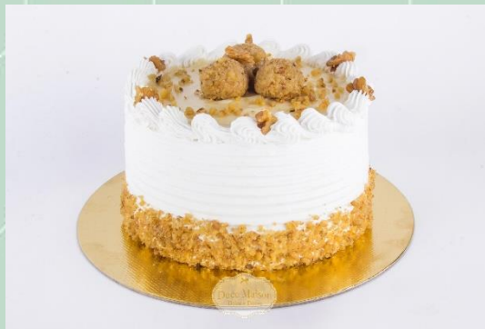
Torta de Nozes com Creme Branco