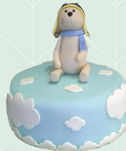
Bolo decorado com pasta americana com modelagem - Antecedência de 15 dias