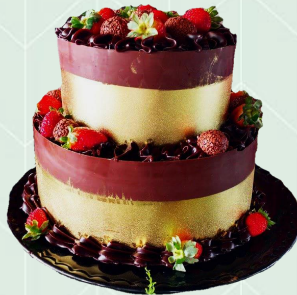
Bolo decorado com tala de chocolate e dourado