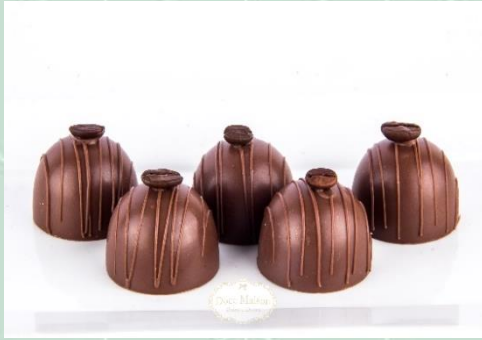
Trufa de Café