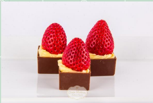
Caixinha de Morango