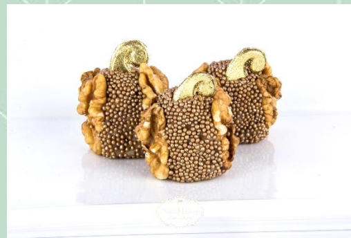
Borboleta de Nozes