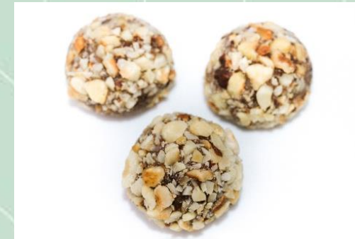
Brigadeiro de Avelãs