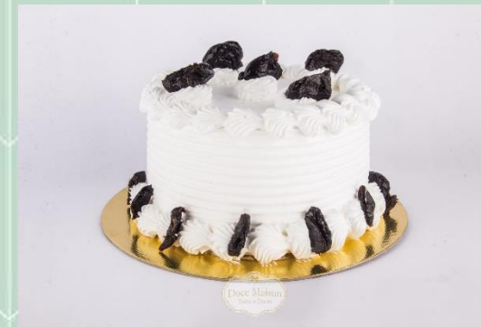
Torta de Ameixa com Creme Branco