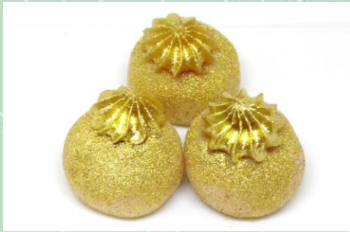
Brigadeiro de Churros