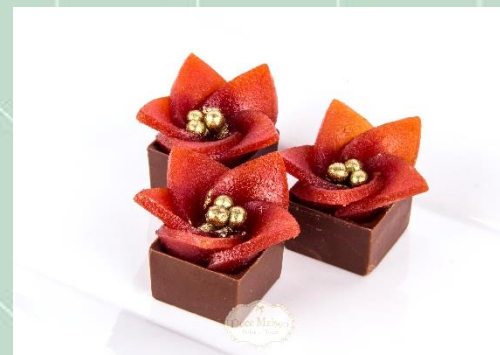
Flor de Goiabinha