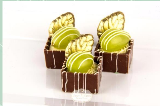
Presentinho de Uva