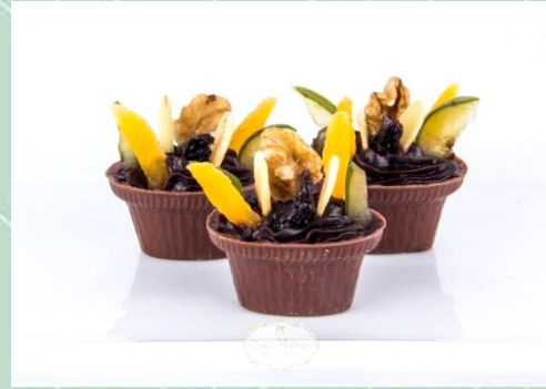
Cestinha de Frutas Secas com Castanhas