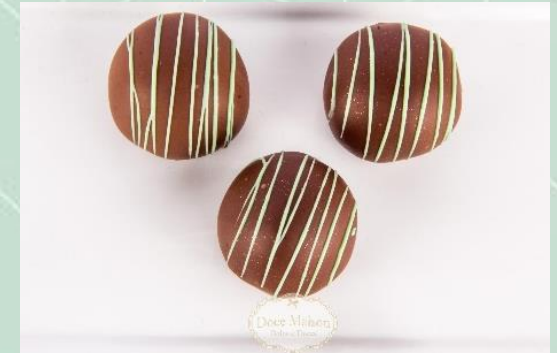
Bombom de Uva