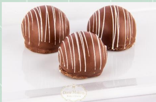
Bombom de Palha Italiana