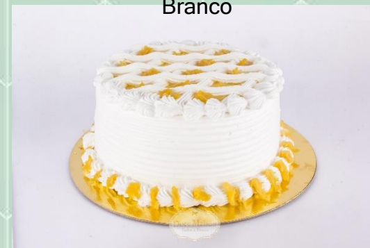
Torta de Abacaxi com Creme Branco