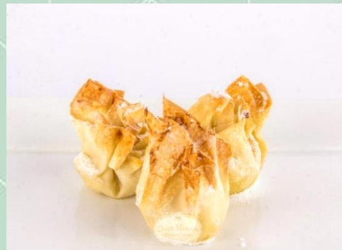
Trouxinha de Massa Filó Recheada