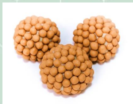
Brigadeiro Belga no Crispy de Caramelo