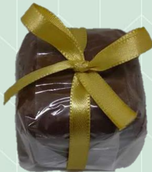
Pão de Mel

Massa suculenta elaborada com Cacau. Escolha o recheio da sua preferência: Brigadeiro tradicional ou doce de leite