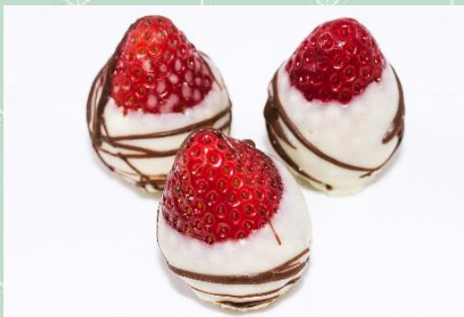
Morango Banhado no Chocolate