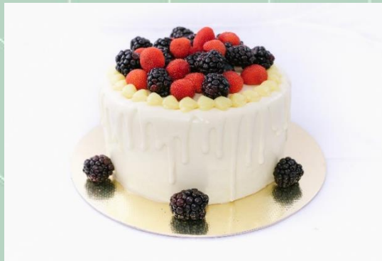
Torta de Frutas Vermelhas