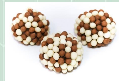
Brigadeiro Belga no Crispy Misto