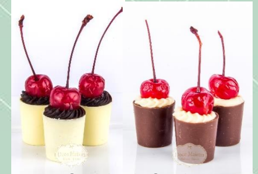
Copinho de Cereja