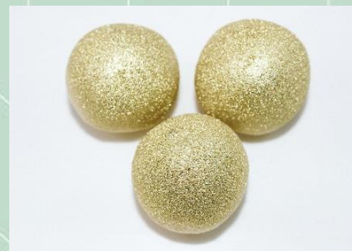
Bombom Belém Uva