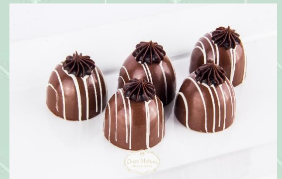
Bombom de Nutella