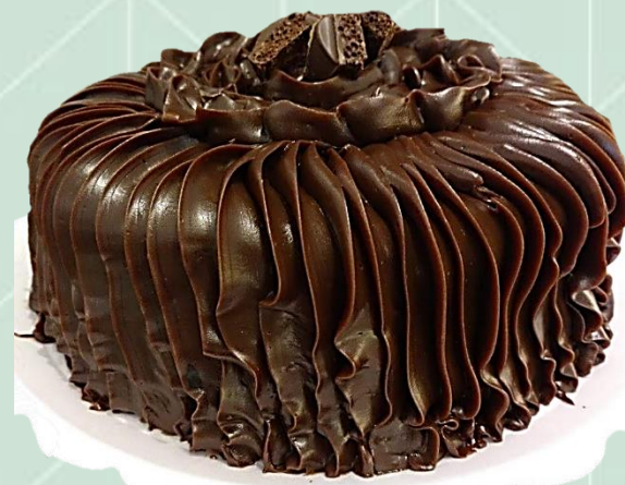
Bolo com bico (rosas) de ganache