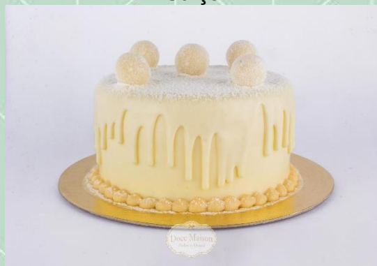
Torta de Leite Ninho