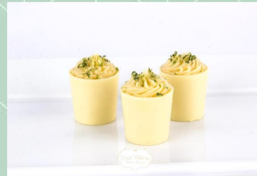
Copinho de Limão