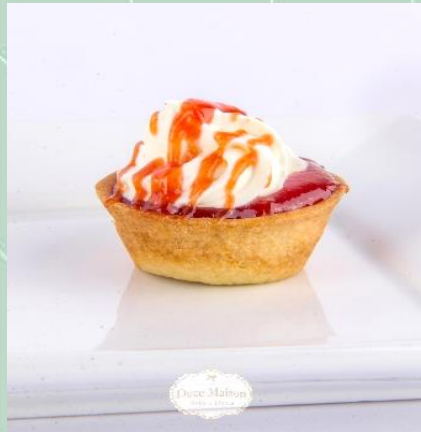
Tartelete de Maçã