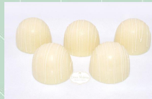
Bombom de Brigadeiro Branco