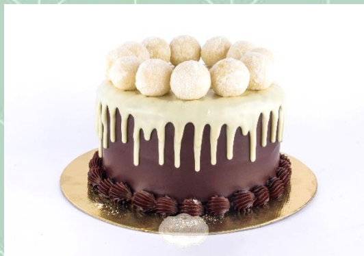
Torta de Nutela com Leite ninho