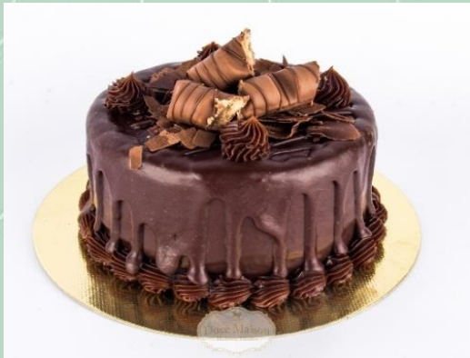
Torta Kinder Bueno