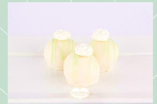
Fondado de Uva