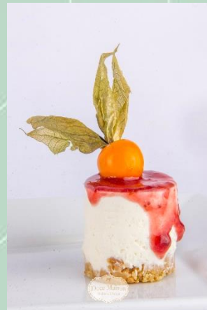
Mini Cheesecake de Goiabada