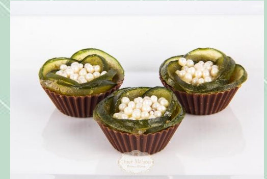
Flor de Figo