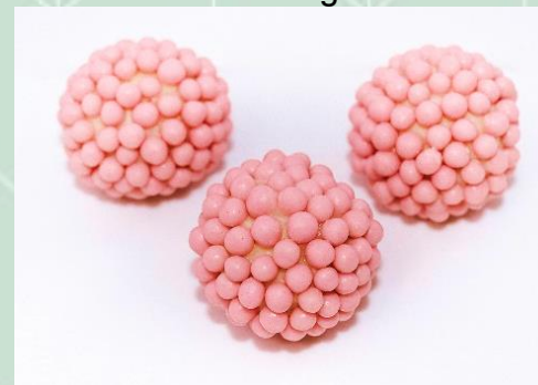
Brigadeiro Belga no Crispy de Morango