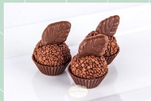
Brigadeiro Belga com Forminha de Chocolate