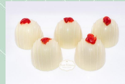
Trufa de Chocolate Branco com Cereja