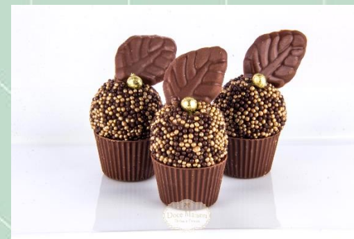
Satinê de Uva