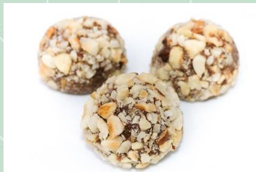
Brigadeiro de Castanha do Pará