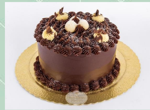
Torta de Sufclair com Brigadeiro Branco