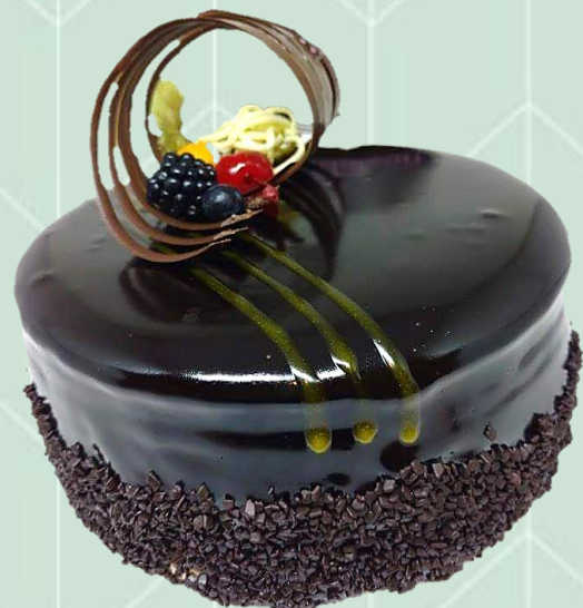
Bolo com cobertura espelhada