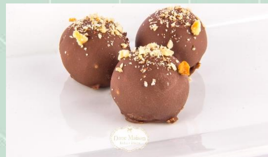
Bombom de Avelãs