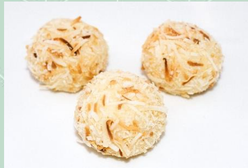
Brigadeiro Branco no Coco Queimado