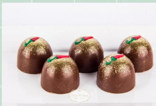
Trufa de Pimenta