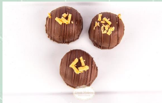
Bombom de Brigadeiro Caramelizado