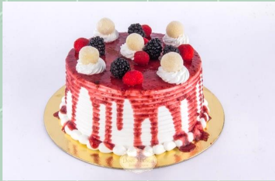
Torta de Leite Ninho com Frutas Vermelhas