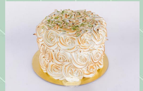
Torta de Limão