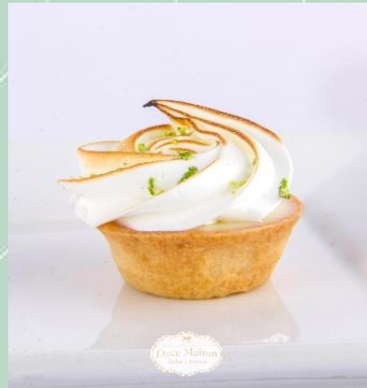
Tartelete de Limão