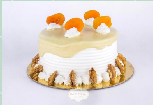
Torta de Nozes com Damasco