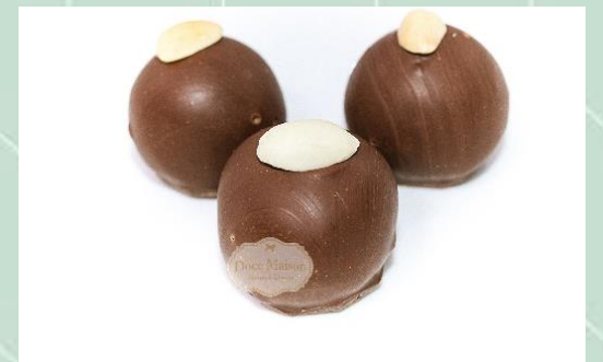
Bombom de Amendoim