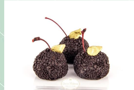
Floresta Negra de Chocolate Belga