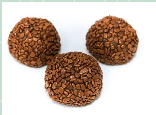
Brigadeiro 100% Belga ao Leite