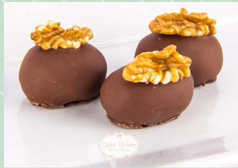
Camafeu de Nozes