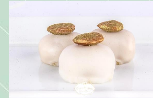
Camaféu de Amêndoas Fondado