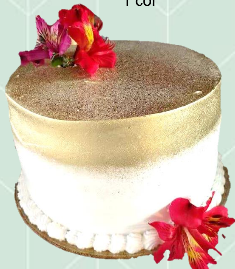
Bolo decorado com flores e dourado