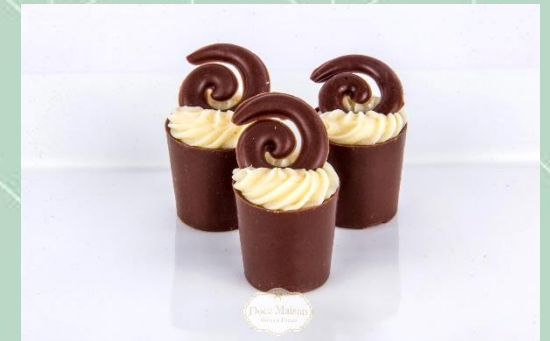
Copinho de Nutella com Brigadeiro Branco