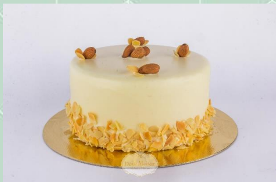
Torta de Amêndoas com Creme Suíço