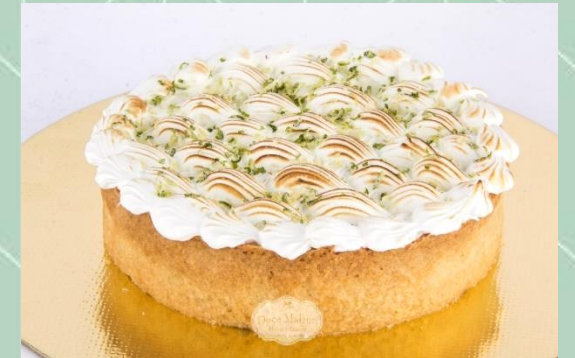
Tartelete - Disponível nos sabores limão, morango e frutas vermelhas