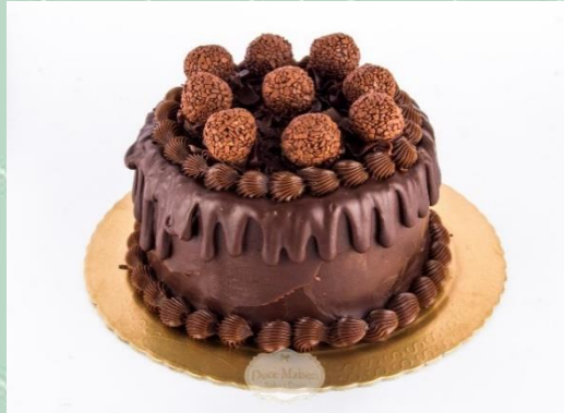
Torta de Brigadeiro