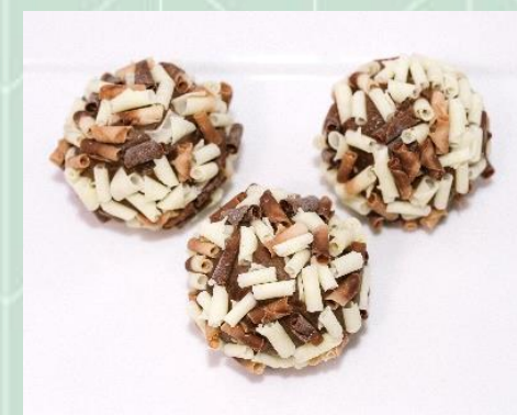
Brigadeiro Belga no Blosson Misto (ao leite e branco)