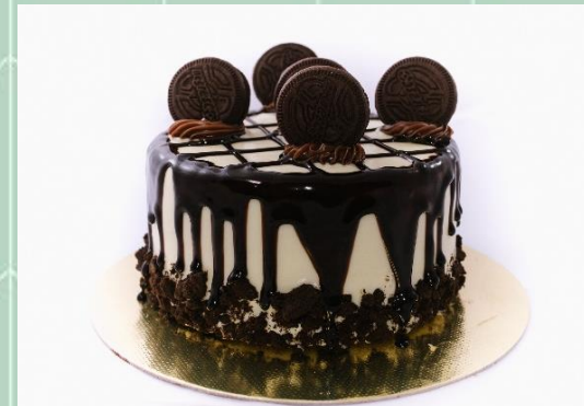
Torta de Oreo