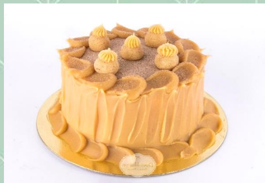
Torta de Churros