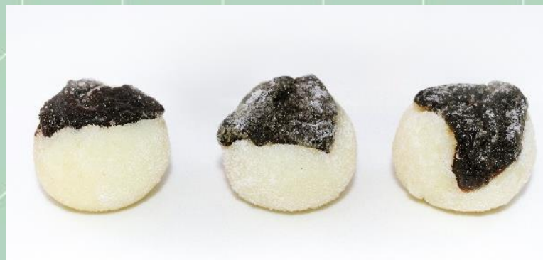
Olho de Sogra