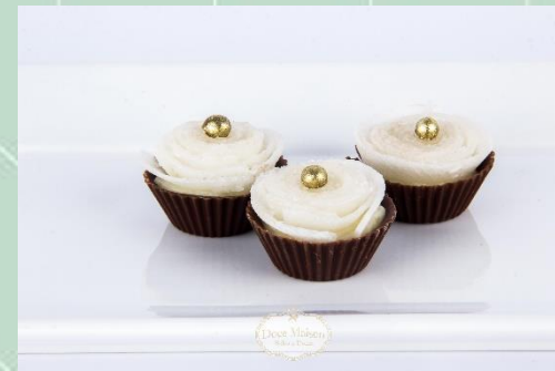
Flor de Coco