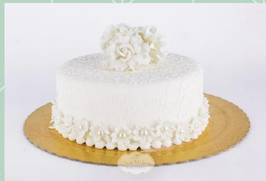
Bolo de Pasta Americana (decoreção simples)