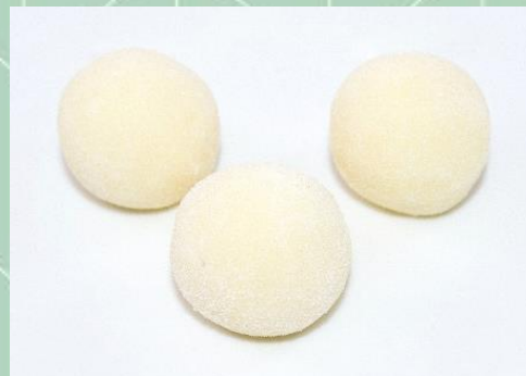
Doce de Leite Ninho