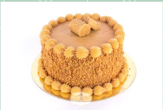
Torta de Paçoca