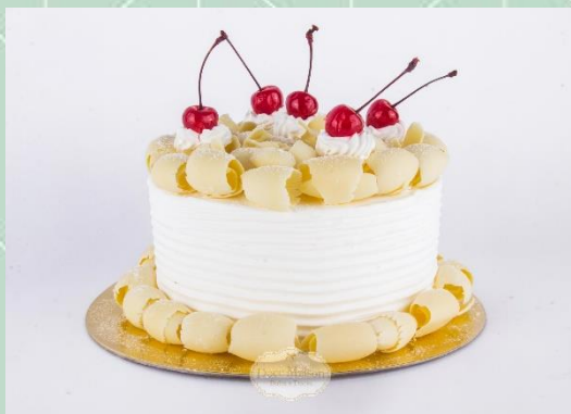
Torta Floresta Branca