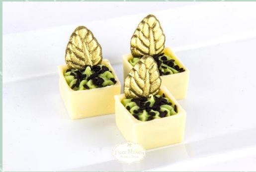
Caixinha de Pistache