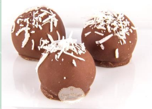
Bombom de Coco