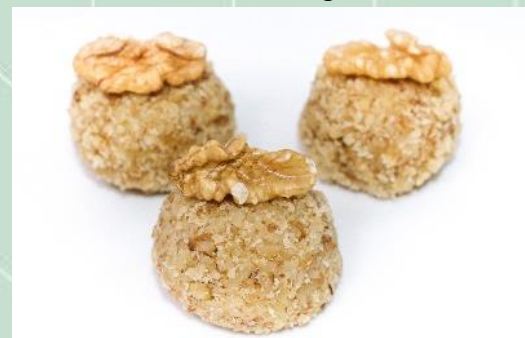
Brigadeiro de Nozes