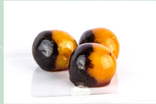
Olho de Sogra Caramelizado