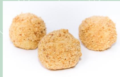
Brigadeiro de Paçoca