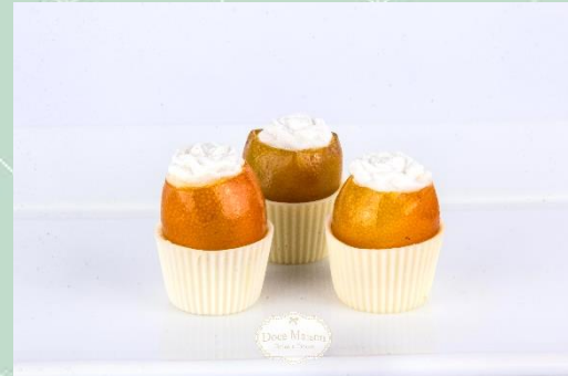
Mini Laranjinha Kin Kan