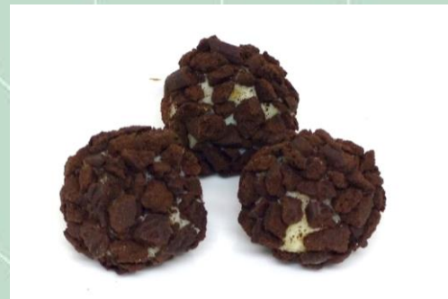
Brigadeiro de Oreo