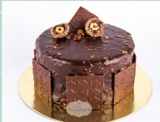
Torta Ferrero Rocher