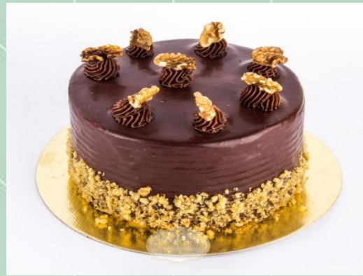
Torta de Nozes de Chocolate