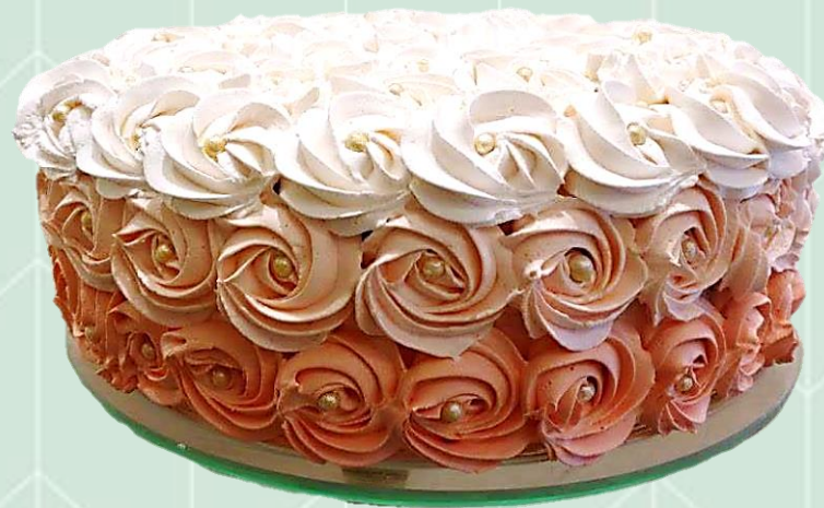
Bolo decorado com bico de rosa - 2 cores