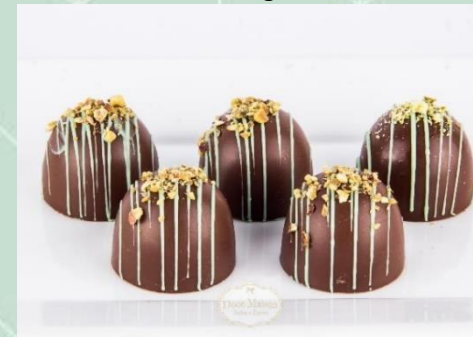
Trufa de Pistache