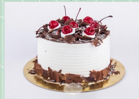
Torta Floresta Negra