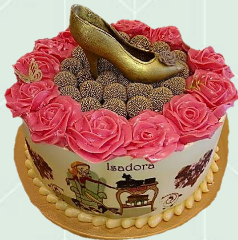
Bolo decorado com tala de chocolate impresso