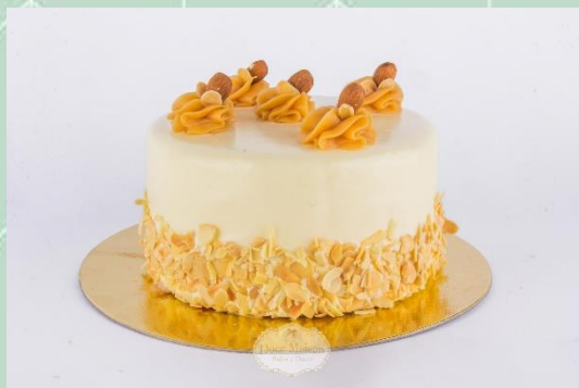
Torta de Amêndoas com Doce de Leite