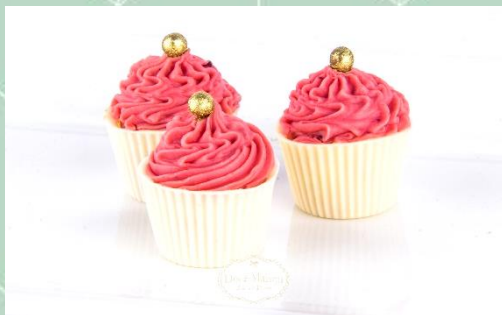
Docinho Mini Cupcake de Frutas Vermelhas