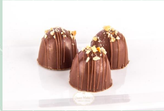
Trufa de Castanhas