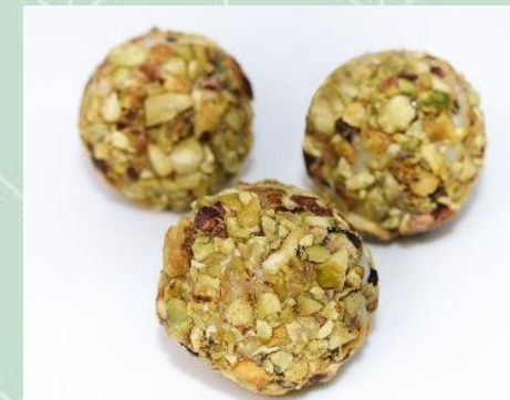
Brigadeiro de Pistache